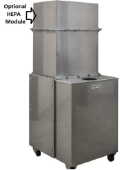
HEPA Filter Module - Optional