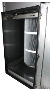
CD-600 SS Purge Filter Cartridge in housing