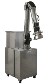
Dust Extraction Arm - Optional