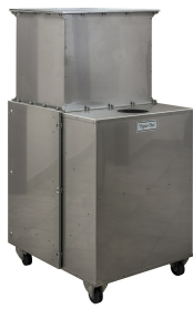
CD-600 EX STAINLESS STEEL CAT. 3GD Z2-22 - P/N 113007B1