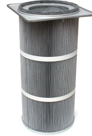
CD/TV-600/1200 Purge Filter Cartridge - Included