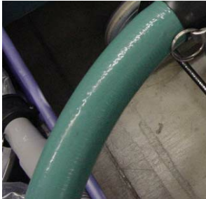
Vinylife Connection Hose Assembly - Included