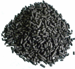
Activated Carbon Pellets - Included

Bitte beachten Sie, dass die Spezifikationen ohne vorherige Ankündigung geändert werden können