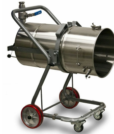
Tilting Cart Assembly