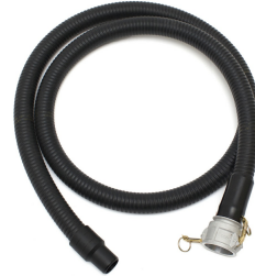
Kanaflex Suction Hose Assembly - Included